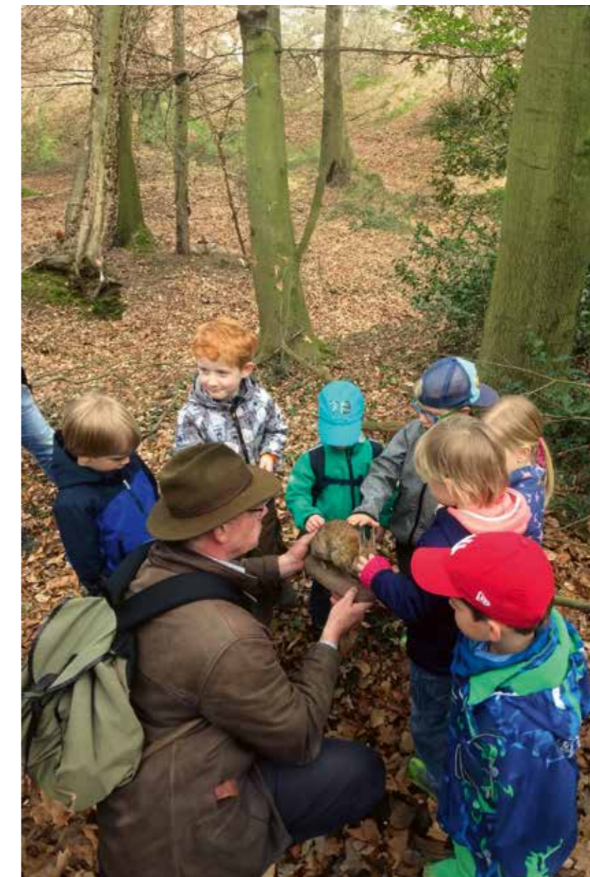
Kinder werden mit dem Wald und seinen Bewohnern vertraut gemacht

Die versammelten Vereinsvertreter zeigten sich sehr interessiert und teilweise erstaunt über die Vielzahl an Aktivitäten der Weseker Jäger, die einem Außenstehenden doch häufig verborgen bleiben, sofern sie nicht das Angebot es Eltern-Kind Waldtages in Anspruch genommen haben.