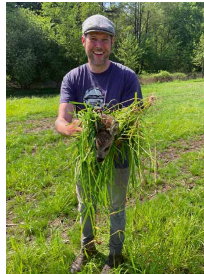
Ein Rehkitz wird fachgerecht evakuiert

Wenn im April die erste Grasmahd ansteht, wird auf über 400 ha Grünland die Kitz- und Niederwildrettung durchgeführt. Dabei gehen die Weseker Jäger die entsprechenden Felder ab. Es gilt, insbesondere abgelegte Kitz, Junghasen und die Gelege von Fasanen aus den Wiesen zu evakuieren oder zu vertreiben. Flatterbänder und Windfahnen verhindern, dass die Tiere in die Wiesen zurückkehren. Denn anders als beim gezielten Abschuss, selektiert das Mähwerk nicht und tötet die noch nicht fluchtfähigen Jungtiere.