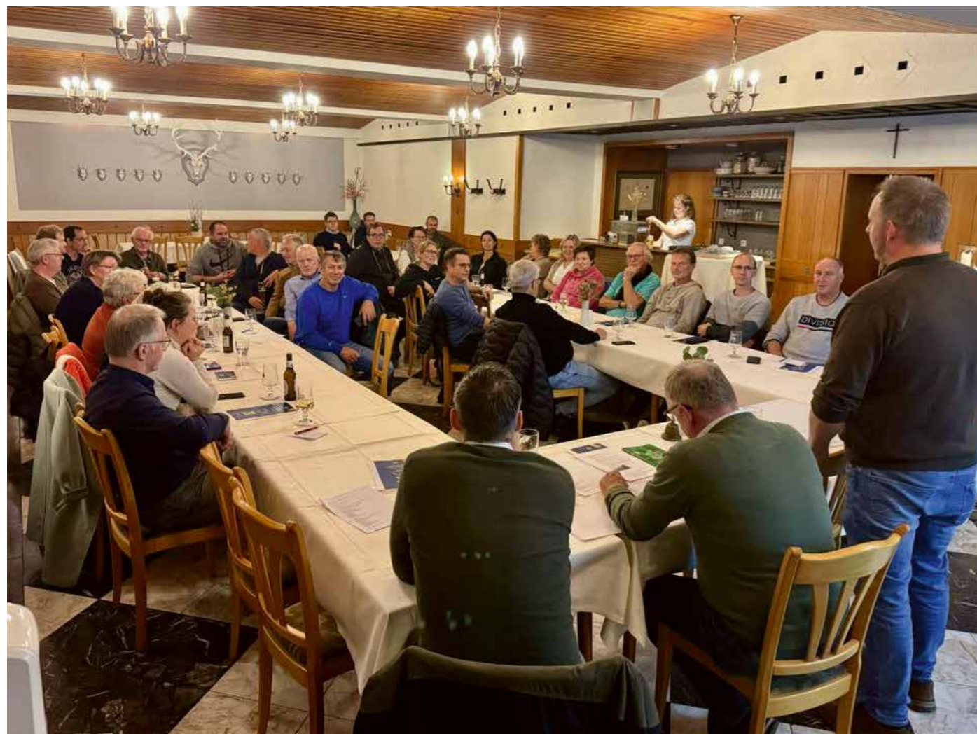
Sehr gut besucht war die Versammlung der Weseker Vereine

Diesen Zeitraum nutzt die Jägerschaft, um ihre Hegeversammlungen sowie alle zwei Jahre eine Gehörnschau abzuhalten. Die Gehörnschau ermöglicht den verschiedenen Revierhabern Rückschlüsse auf den Lebensraum in ihren Revieren und die Dichte der Rehwildpopulation zu ziehen, die einen großen Einfluss auf die Entwicklung der einzelnen Rehböcke hat. Ist die Population zu hoch, sind die Rehböcke eher klein, da sie in ständigem Konkurrenzdruck stehen.